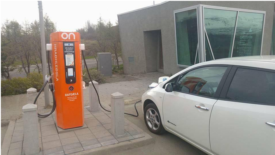
Mynd 2. Dæmi um ekkert aðgengi að hleðslustöð, miklar hindranir.