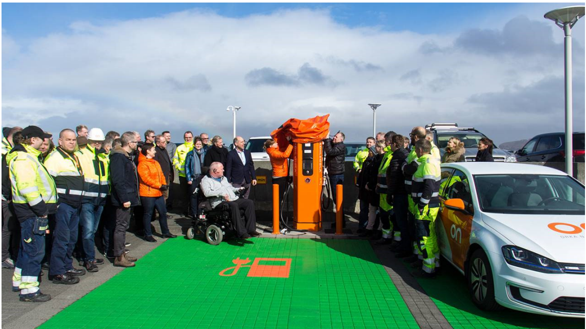
Mynd 3. Dæmi um góða hönnun á hleðslustöð. Engar hindranir. Vantar þó að merkja stæðið hreyfihömluðum.