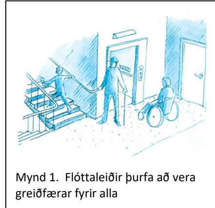
Mynd 1. Flóttaleiðir þurfa að vera greiðfærar fyrir alla

Í e. lið 1. gr. laga nr. 160/2010 um mannvirki segir að eitt af markmiðum laganna sé að tryggja aðgengi fyrir alla. Það þýðir m.a. að við hönnun bygginga þurfa hönnuðir að velja gerð og skipulag flóttaleiða með það í huga að allir í viðkomandi rými geti bjargast út af eigin rammeik eða fyrir tilstilli annarra á tilgreindum flóttatíma.