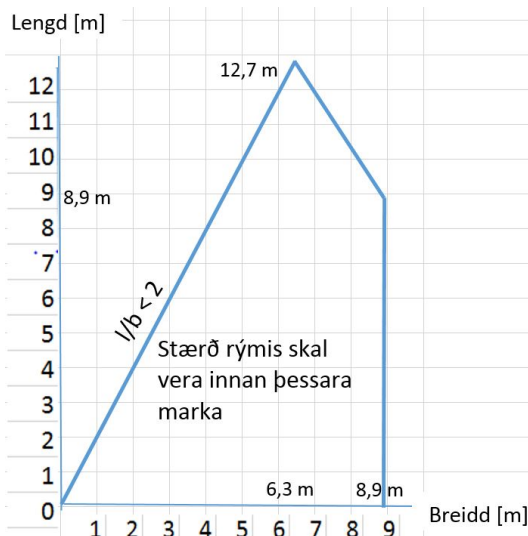
Mynd 1. Stærðarmörk rétthyrndra rýma miðað við reiknireglu f. Til að halda hlutfalli milli lengdar og breiddar rýmis < 2 er lengsta rými 12,6 m sem þá krefst minnstu breiddar 6,3 m. Stysta reikningslega göngulengd er þá um 15 m að hurð. Ferhyrnt rými er mest 8,9x8,9 m með stystu göngulengd um 13 m.