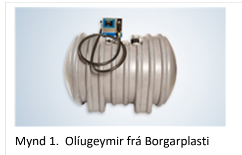
Mynd 1. Olúgeymir frá Borgarplasti

Algengt er að settir séu upp olúgeymar ofanjarðar fyrir eldfima vökva í flokki III.1 (diselolíu) upp að 4.000 lítrum. Þessir geymar geta til dæmis verið staðsettir hjá bensínstöðvum, þá aðallega neðanjarðar, verk-tökum eða bændum. Þetta á þó ekki við um tanka við birgðarstöðvar samanber reglugerð 35/1994 um varnir gegn olíumengun frá starfsemi í landi og ekki um tanka sem notaðir eru til að safna afgangsolíu. Olúgeymar sem eru sambyggðir vélum/raftækjum eru flokkaðir sem dagtankar sem innihalda olíu fyrir notkun í einn sólarhring, og er leyfilegt að hafa þá inni í þeim rýmum sem vélin er í. Þetta rými þarf að vera sérstakt brunahólf, samkvæmt 9.6.11 og með ráðstafanir til að olían geti ekki runnið fram úr herberginu það er með þröskuldi og niðurfalli tengdu olúskilju.