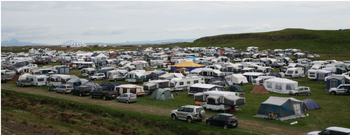
Mynd 1 Þéttsetið tjaldstæði í tengslum við íþróttamót.

Tjaldsvæði geta verið staðsett fjarri stöðvum slökkviliða þannig að þegar kviknar í þá getur langur tími liðið þar til hjálp berst og tjón getur orðið verulegt. Því er mikilvægt að vel sé hugað að brunavörnum á tjald- og hjólhýsasvæðum og að reynt sé að draga úr líkum á íkviknun eins og unnt er.