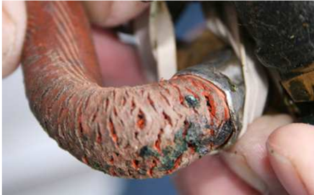
Mynd 3 sýnir morkna gasslöngu sem er orðin hættuleg.

slönguna. Ef það myndast loftbólur eru lagnirnar óþéttar og skulu þær lagfærðar eða skipt út. Lekar gaslagnir geta skapað mikla eld- og sprengihættu.