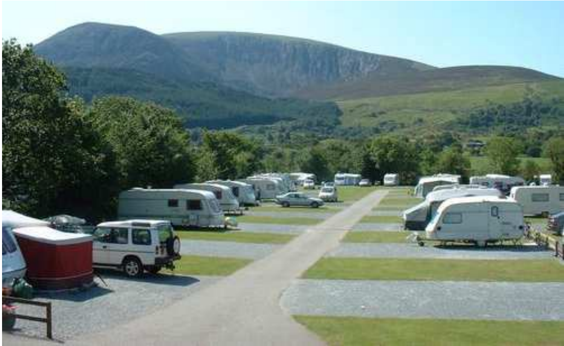
Mynd 4 sýnir hjólhýsasvæði Bryn Gloch Caravan and Camping Park í Wales. Hér eru svæðin fyrir hvern ferðavagn skýrt afmörkuð með bundnu yfirborði en grasflöt á milli.